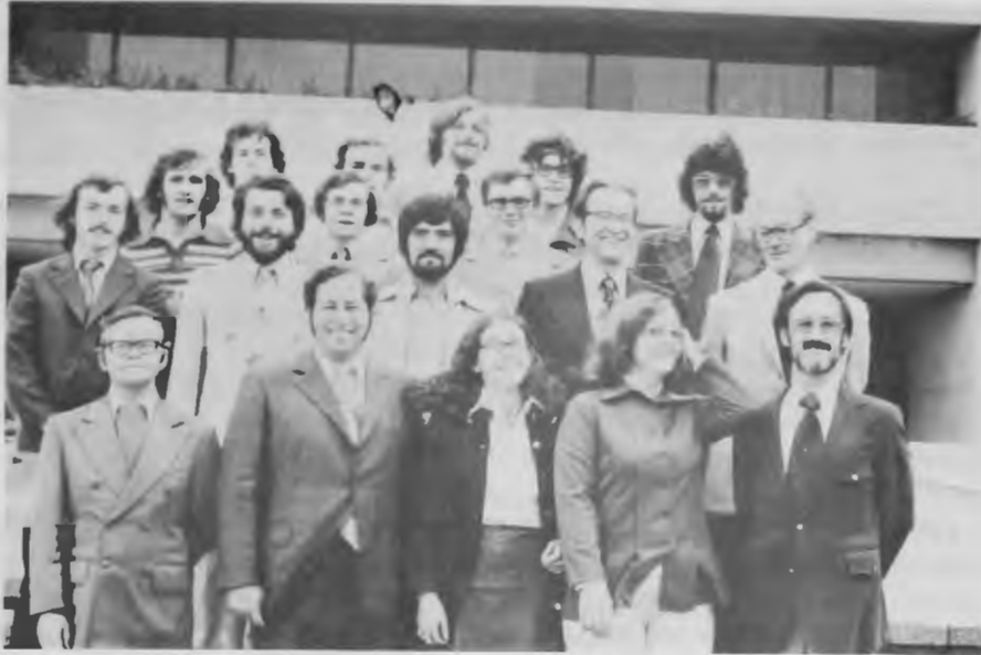
Photo de la classe UQAM No. 2 prise après la cérémonie de graduation (le 13 juin, 1974) à l'entrée du quartier général du SEA.