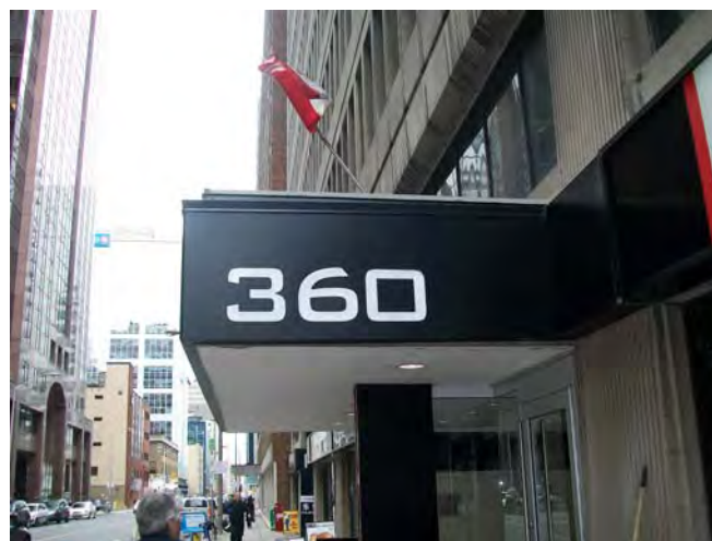
CMOS Office on Laurier Street West on the 4th floor Bureau de la SCMO au 4 e étage sur la rue Laurier ouest

Le but de la SCMO est de stimuler l'intérêt pour la météorologie et l'océanographie au Canada.