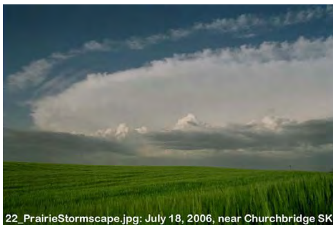
22_PrairieStormscape.jpg: July 18, 2006, near Churchbridge SK